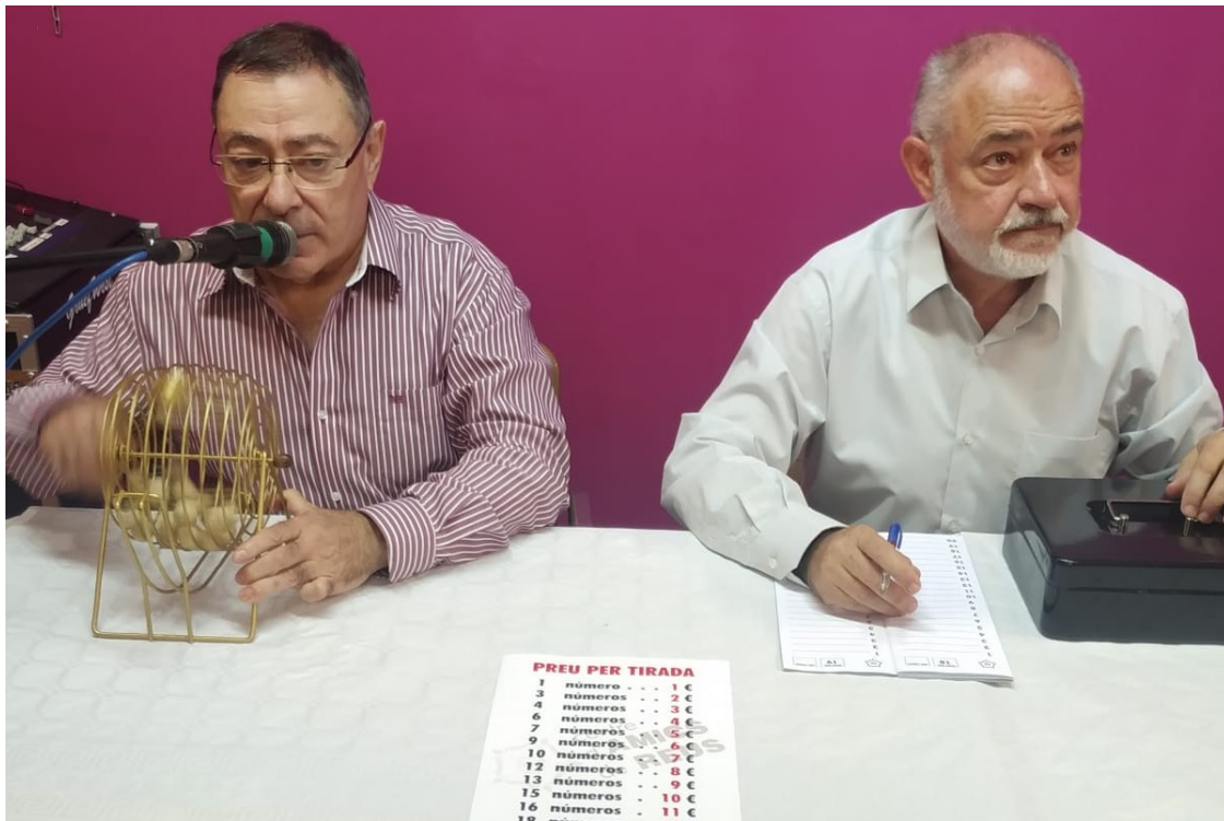
Al Centre d'Amics de Reus també s'hi organitza la tradicional rifa de confitura per Tots Sants