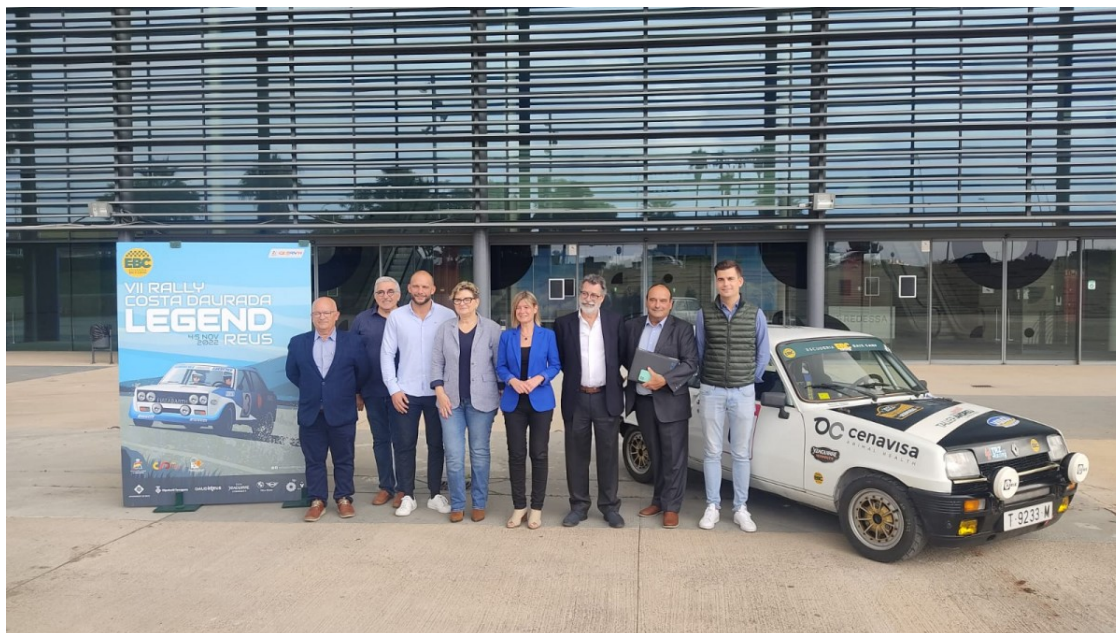
Presentació del setè ral·li Costa Daurada Legend Reus

La prova, que té lloc el 4 i el 5 de novembre, apunta a rècord de participants