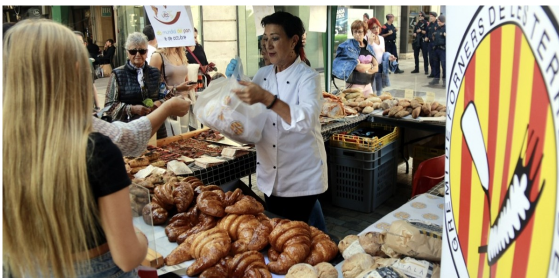
Un flequer agafant pa

A la campanya "Sense llum no hi ha pa" s'hi sumen altres entitats del sector, com a mesura de protesta contra l'encariment de l'energia