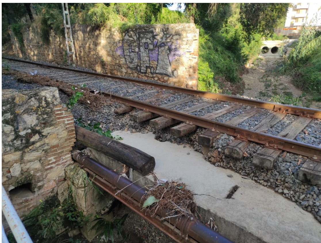
Travesses de la via ferroviària entre la Pobla de Mafumet i El Morell sense suport arran de les pluges torrencials | Gepec

Els ecologistes denuncien que la infraestructura s'ha deteriorat "més" fruit de les últimes pluges al Camp