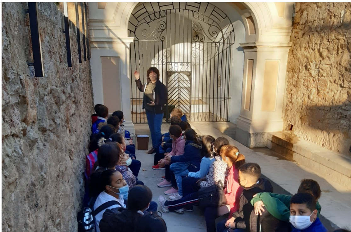
Canalla a la Boca de la Mina, en una visita | Reus.cat

El curs passat hi va haver 608 visites d'alumnat de la ciutat i del Baix Camp