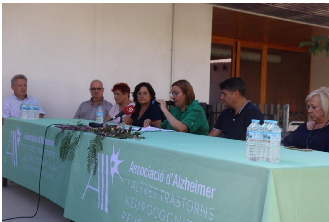
L'Associació d'Alzheimer i Altres Trastorns Neurocognitius, en roda de premsa

L'entitat està situada en unes instal·lacions de la Fundació, que els suposen un cost de 4.537 euros mensuals