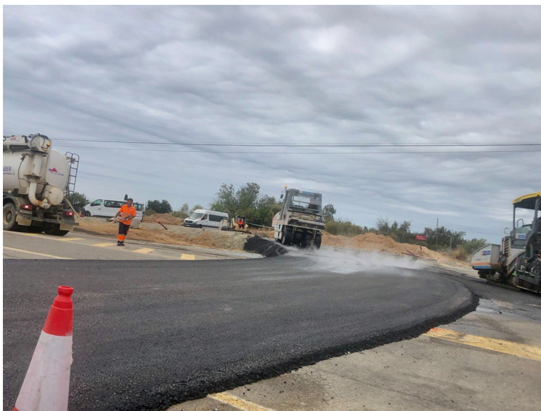
Treballs de pavimentació a la rotonda que connectarà el nord de Cambrils amb la T-312

Una rotonda ha de connectar aquesta zona del terme amb la carretera T-312