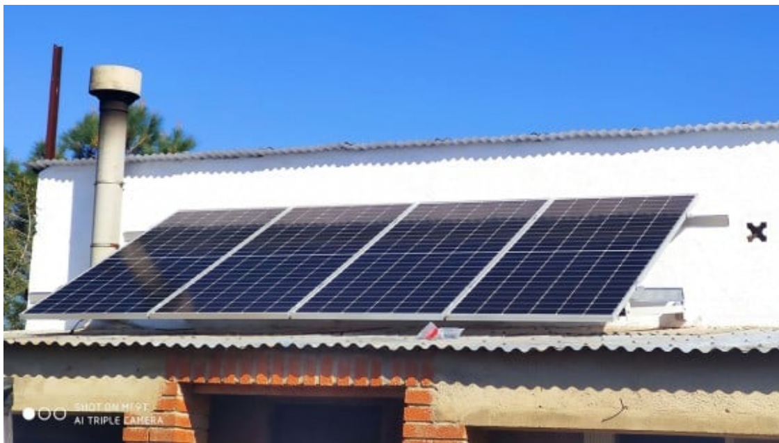
Plaques solars al sostre d'un habitatge de Cambrils.

En total, els afectats calculen que la presumpta estafa supera els 100.000 euros . A través de les xarxes socials tots ells s'han posat en contacte i han creat un grup de WhatsApp , que a mitjans d'agost ja comptava amb 22 persones que asseguren haver estat víctimes de Sunblitz Kraft.