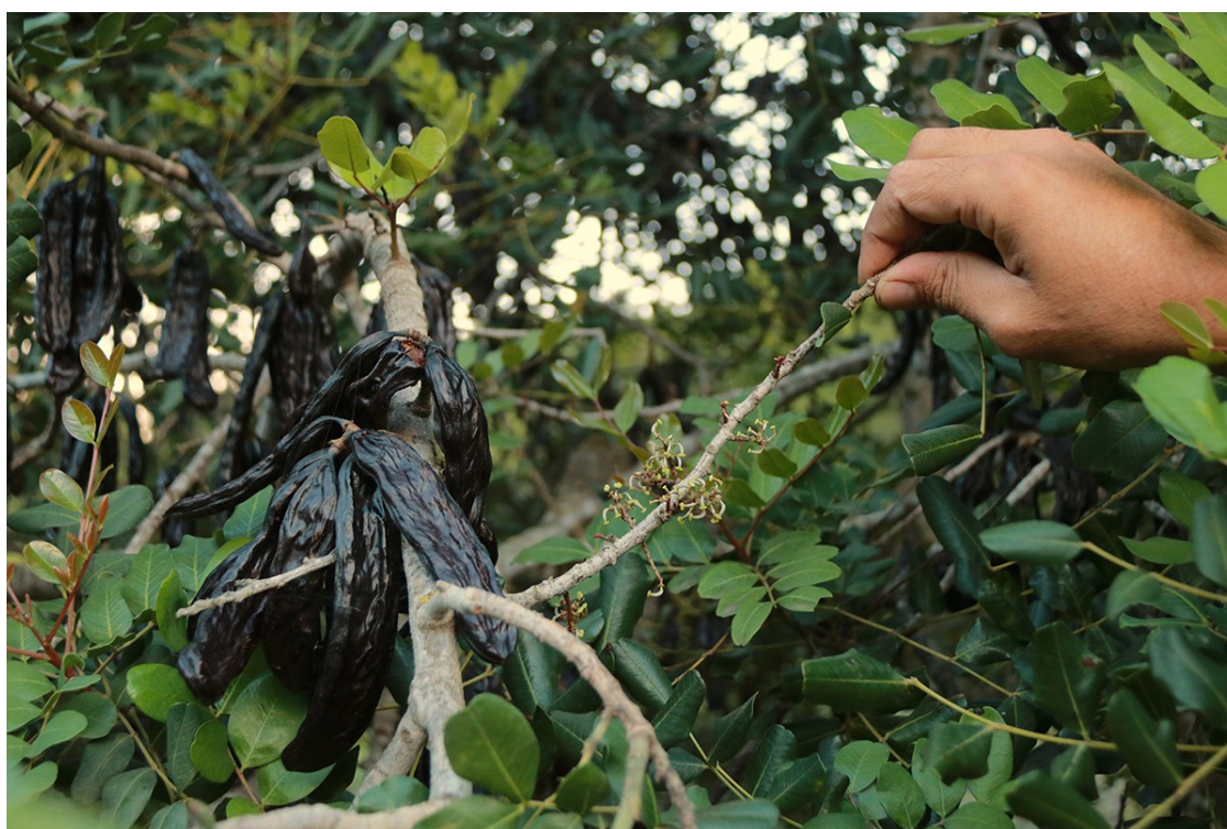
Unes garrofes i les flors del garrofer, en una finca de Masriudoms.

Els lladres arrepleguen els fruits quan encara no són madurs i els venen més barats fora del circuit comercial