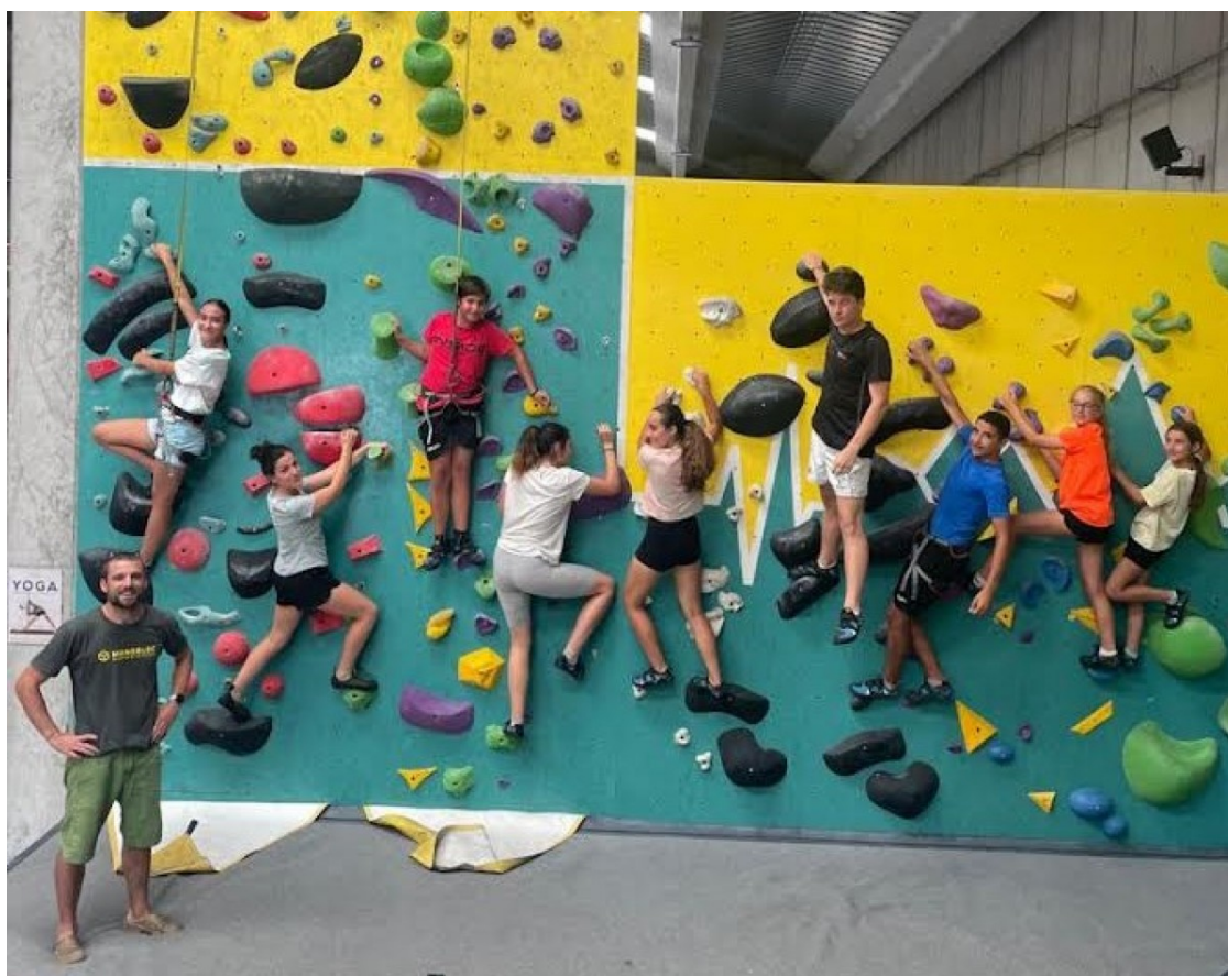
Joves en una de les activitats de lleure de l'estiu a Reus

S'han ofert un total de 80 activitats diverses