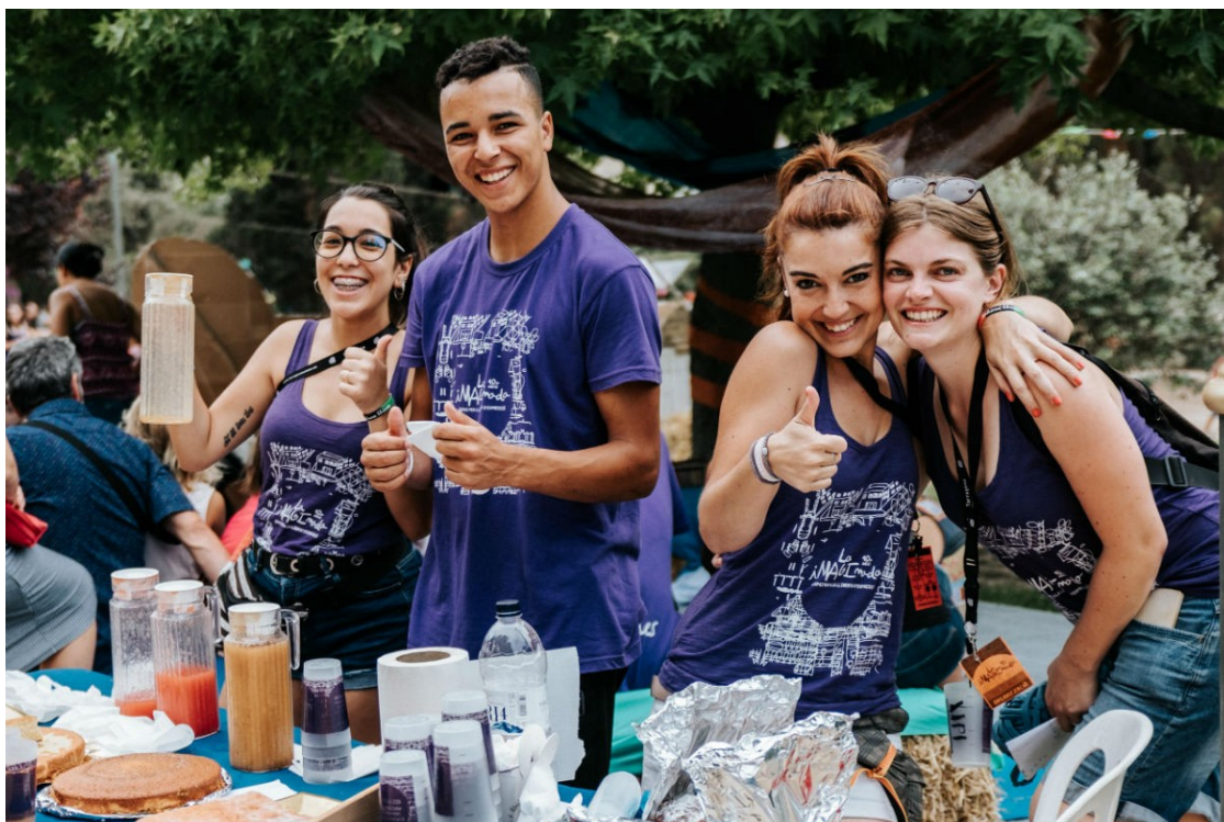
Imatge d'arxiu de la iMAGInada. | Albert Rué

Divendres comença la iMAGInada amb una cinquantena d'activitats que se celebraran als Jardins del Camp de Mart fins dilluns