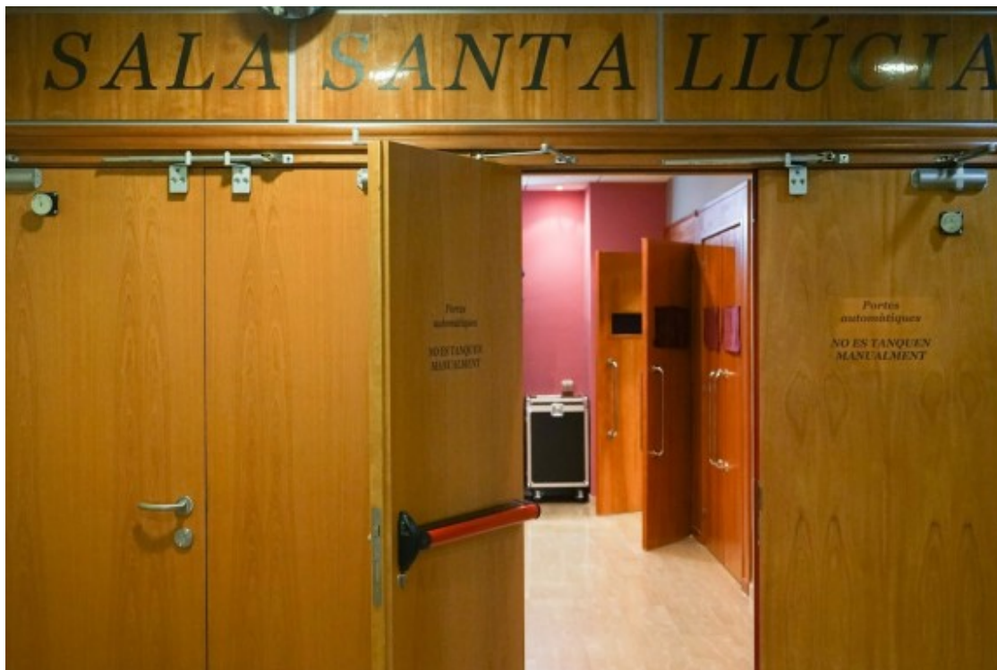
L'entrada de la sala Santa Llúcia

Però, per què és el teatre desconegut? ?No fa gaire, va venir gent de Reus que no sabia que això era aquí?, respon Vallès. Sorprès, afirma que, tot i que s'ha fet molta publicitat, la sala encara no es coneix prou. No obstant això, reconeix que el fet que l'entitat tingués poca activitat fins als anys 90 ha provocat que molta població no la conegui. Actualment, l'entitat compta amb 160 socis .