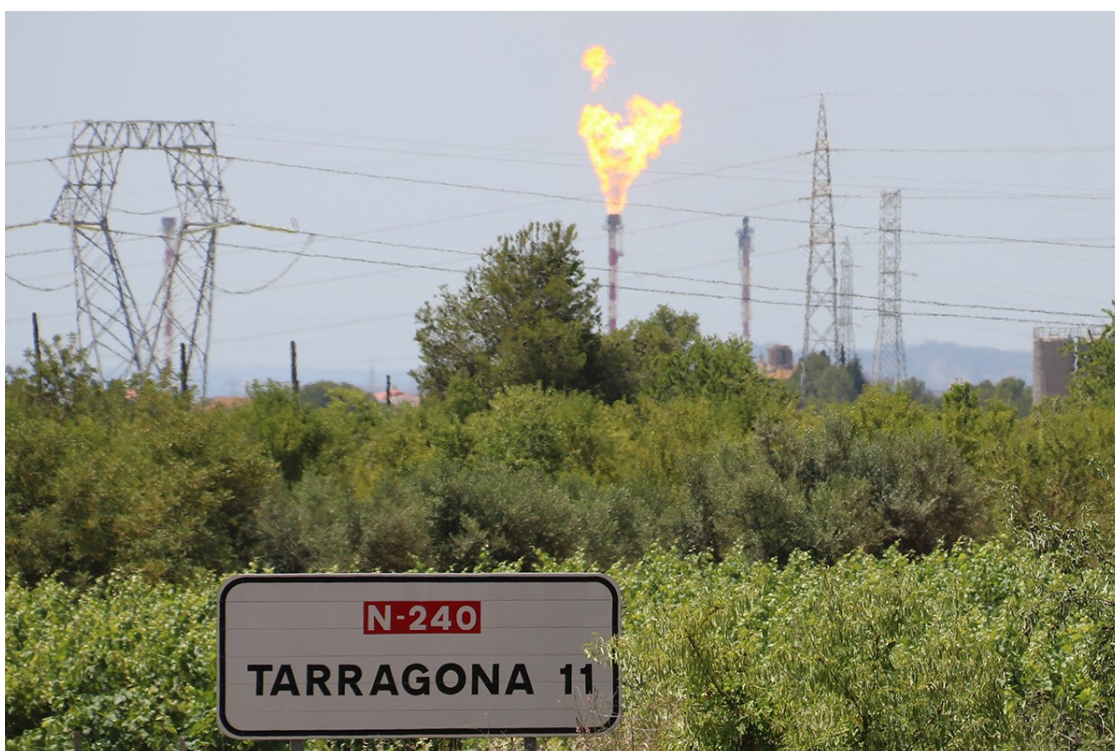
Imatge d'arxiu del polígon químic de Repsol a Tarragona.

El grup petrolier obté un resultat net ajustat de 3.117 milions d'euros, amb una aportació del negoci internacional del 56%