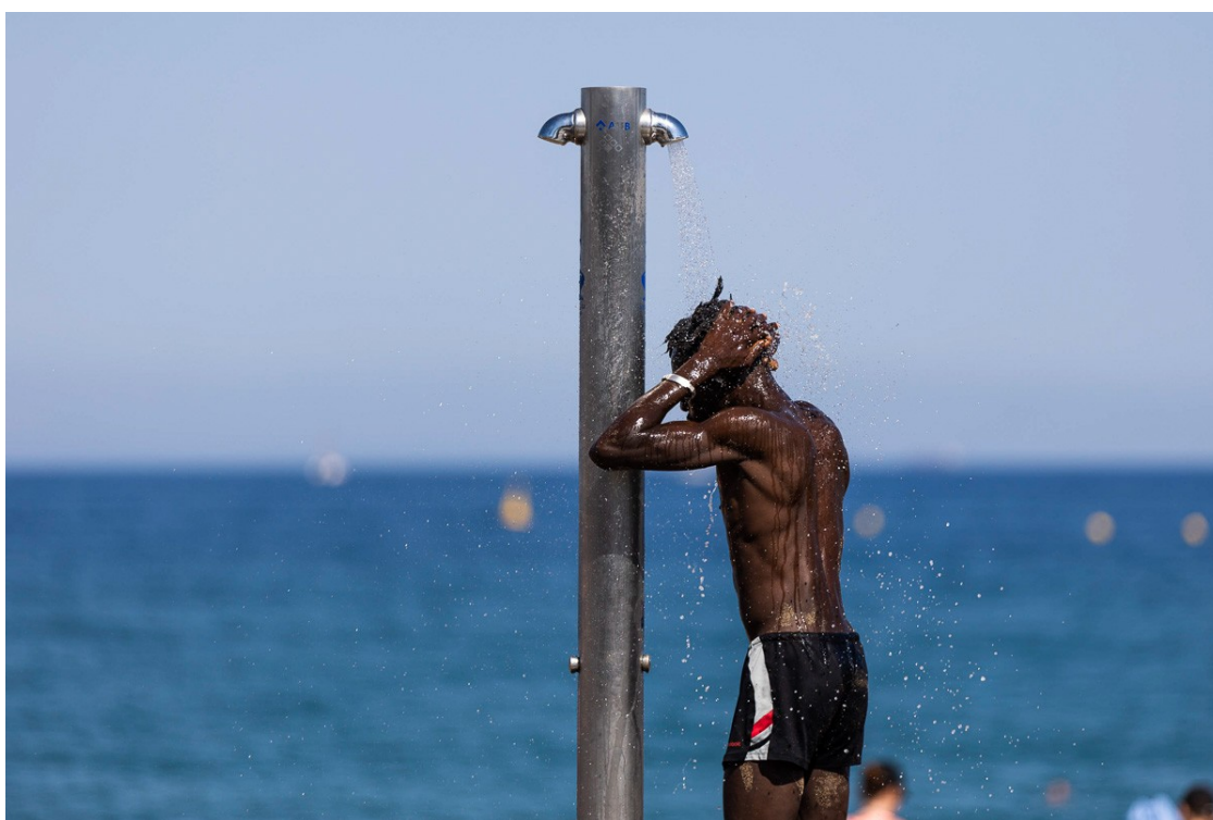
Un noi es dutxa a la platja

Es normalitzen els registres per a l'època de l'any i arriba la inestabilitat, que portarà ruixats a la costa central la pròxima matinada