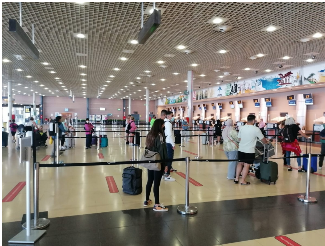
Passatgers a la terminal de l'aeroport de Reus

En aquest període, per la base de la capital del Baix Camp hi van passar 154.181 passatgers