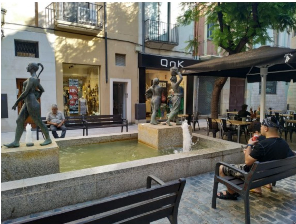
Veïns asseguts al voltant de «Les bugaderes»