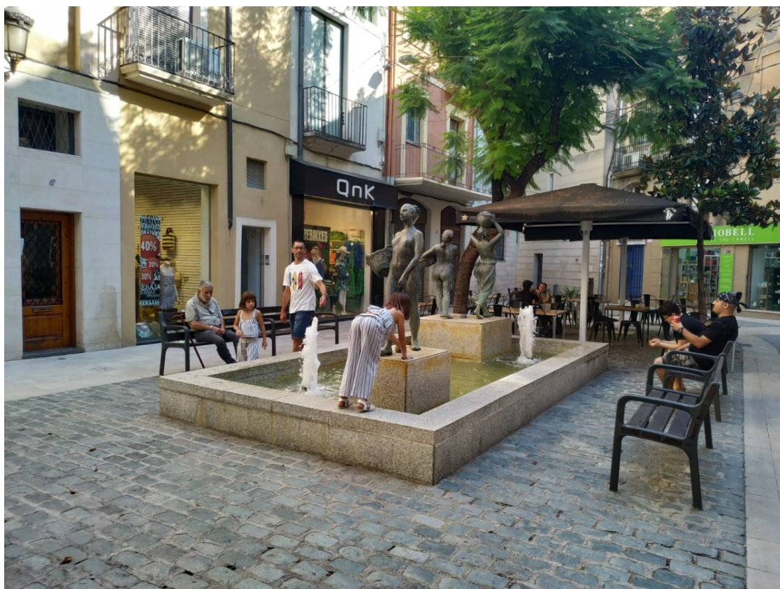
La plaça de les Basses, aquesta setmana

En destaquen el vell magatzem amb elements modernistes i "Les bugaderes" d'Artur Aldomà