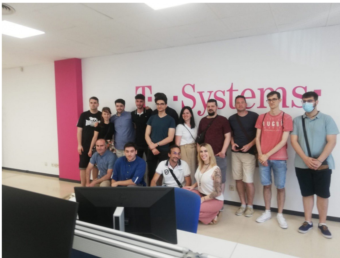
Imatge d'alumnes de la formació d'inserció laboral al sector de les TIC

A través d'un programa per optar a feines en un sector amb "alta demanda" de professionals formats