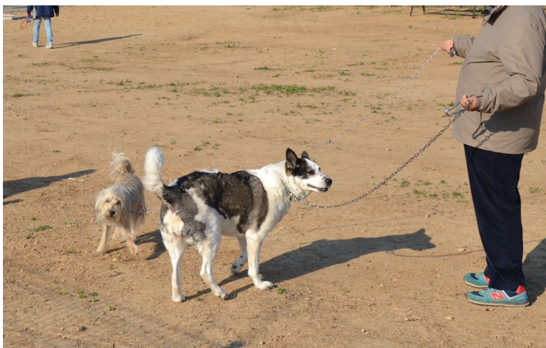
Una zona d'esbarjo per a gossos | Reus.cat

El ple va aprovar, l'any passat, una moció del PSC per l'adhesió al programa Viopet, del Ministeri de Drets Socials i Agenda 2030