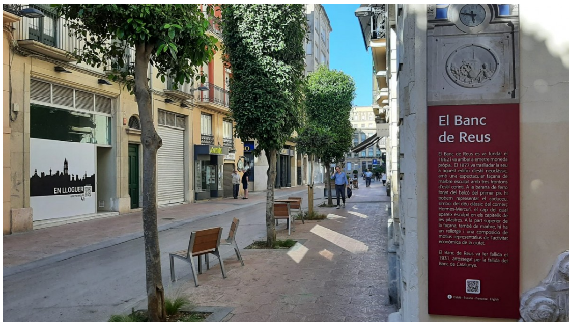
Nova senyalització al Banc de Reus | Reus.cat

En el marc del procés de reconversió de la via en una zona per a vianants