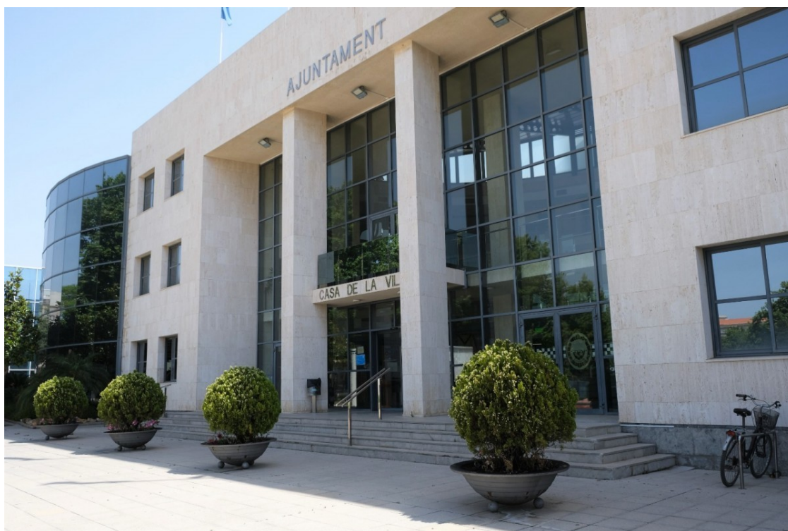
Una imatge de l'Ajuntament de Cambrils | Cedida

La Generalitat aixecat la suspensió perquè el consistori aprova una modificació puntual del POUM