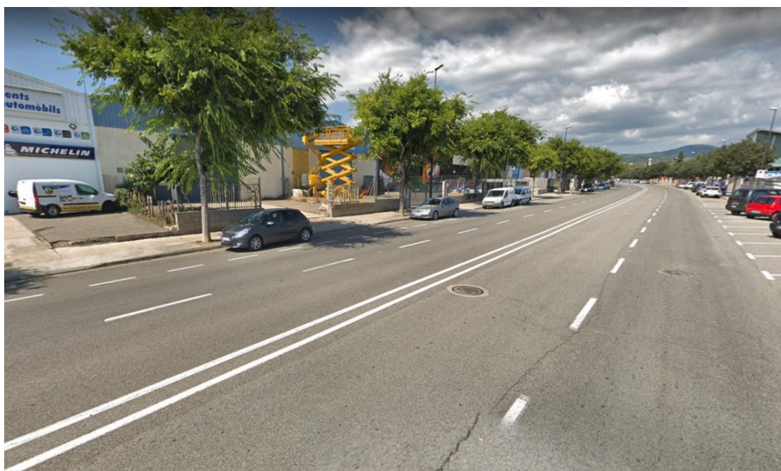
Una imatge del polígon Agro Reus

Una segona proposta socialista al ple se centra en les ocupacions "delictives"