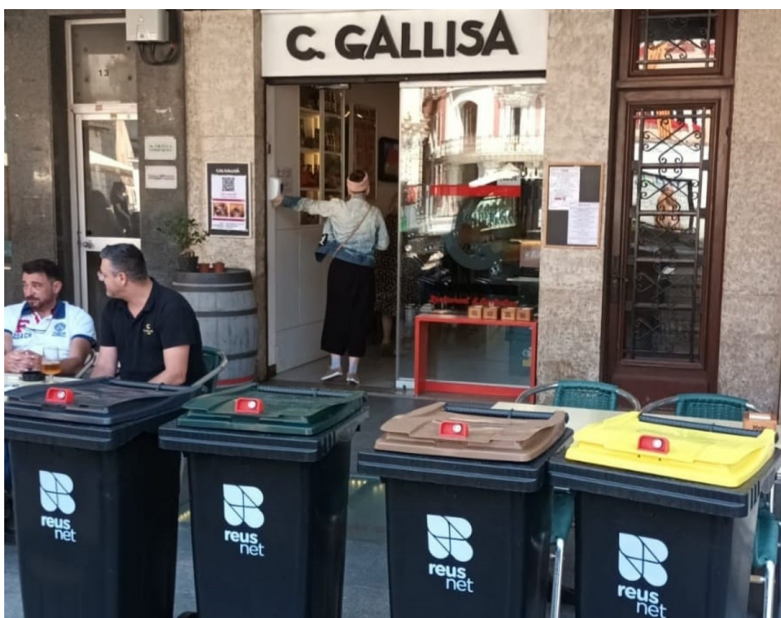
Els contenidors, davant d'un dels restaurants del Mercadal | Reus.cat

S'ha començat pel centre i el nucli antic, pels establiments comercials i de restauració