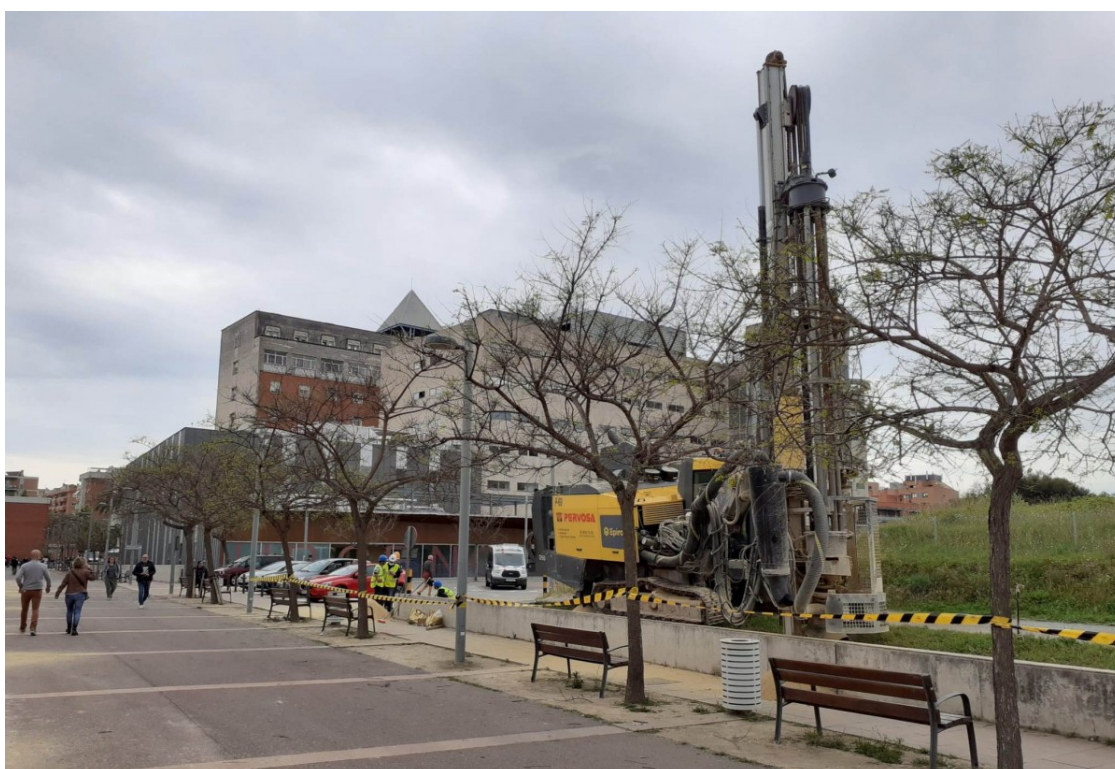
Les prospeccions a l'Hospital Joan XXIII de Tarragona | ICS

Aquesta primera fase del projecte té prevista la modificació de la urbanització per permetre la construcció del futur edifici