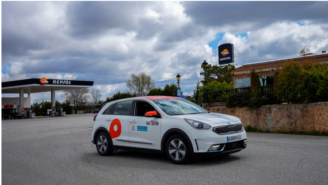
L'equip d'experts en gastronomia de la publicació recorre tot l'estat