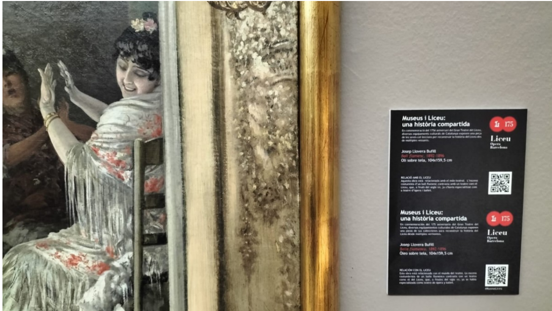
Detall del quadre de Llovera, al Museu de Reus, que també s'ha inclòs al projecte del Liceu

assegudes picant de mans i un home assegut, tocant la guitarra.