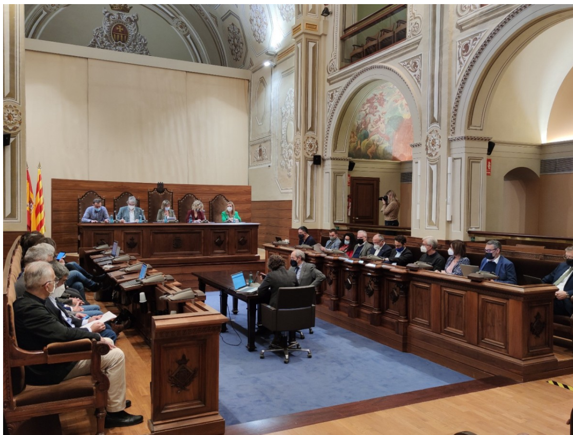
Una imatge del ple de la Diputació

També s'hi inclou ajuts en les línies d'acció social, salut pública, cultura o medi ambient