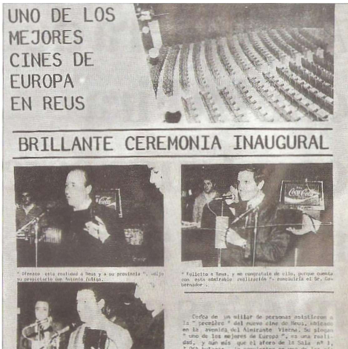
Un retall d'un document de la inauguració del Reus Palace, el 1978

Quan va obrir, l'eslògan del Palace va ser "un dels millors cinemes d'Europa". Segons consta a les cròniques de la inauguració, un miler de persones es van sumar a la primera vetllada del complex dels Zúñiga, qui van comentar que "oferim aquesta realitat a Reus i a la seva demarcació". La sala 1, en el moment de l'obertura, tenia prop de 2.100 butaques.