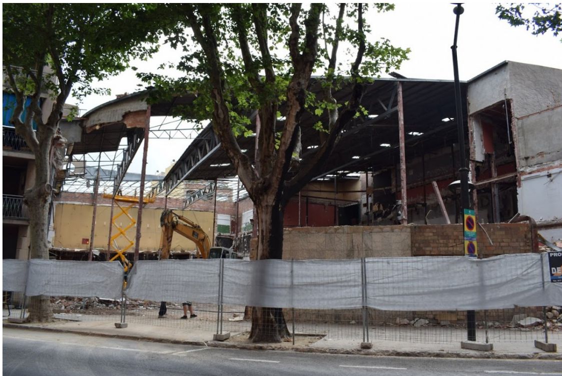
Una imatge de l'enderroc del Palace, el juny de 2017

Es compleixen cinc anys del tancament de les sales gestionades pels Zúñiga al carrer del Batan