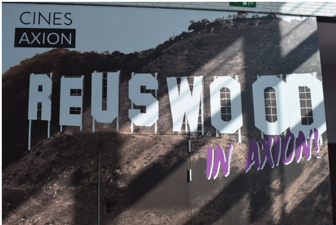
El juliol de 2017 es va anunciar l'obertura dels cinemes Axion a La Fira Centre Comercial de Reus

La firma, d'origen valencià, es va instal·lar al recinte dos anys de la inauguració del complex. De fet, des La Fira sempre es va assenyalar que les sales de cinema havien de ser el "complement idoni" a l'oferta d'oci del centre comercial, a la planta superior, on hi ha bars i restaurants i un espai de lleure. L'aterratge d'Axion a la nostra ciutat es va incloure en el marc de la seva política d'expansió arreu de l'estat. La inversió a Reus va ser d'1,8 milions d'euros, i la programació prevista passava per projectes estrenes comercials, pel·lícules en 3D i altres esdeveniments.