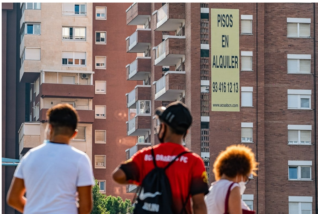
Una pancarta anuncia pisos de lloguer, a la Vall d'Hebron.

L'alt tribunal accepta per unanimitat el recurs del PP perquè considera que la norma envaeix competències estatals. El Sindicat de Llogaters demana desobeir la resolució