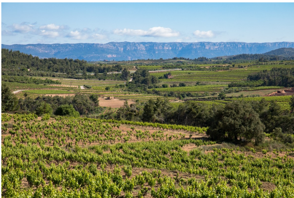
Imatge del paisatge de la DO Montsant | DO Montsant

La regió vitivinícola celebra l'aniversari amb la mirada posada en l'autoconeixement i l'autenticitat com a claus de la qualitat i la singularitat dels seus vins