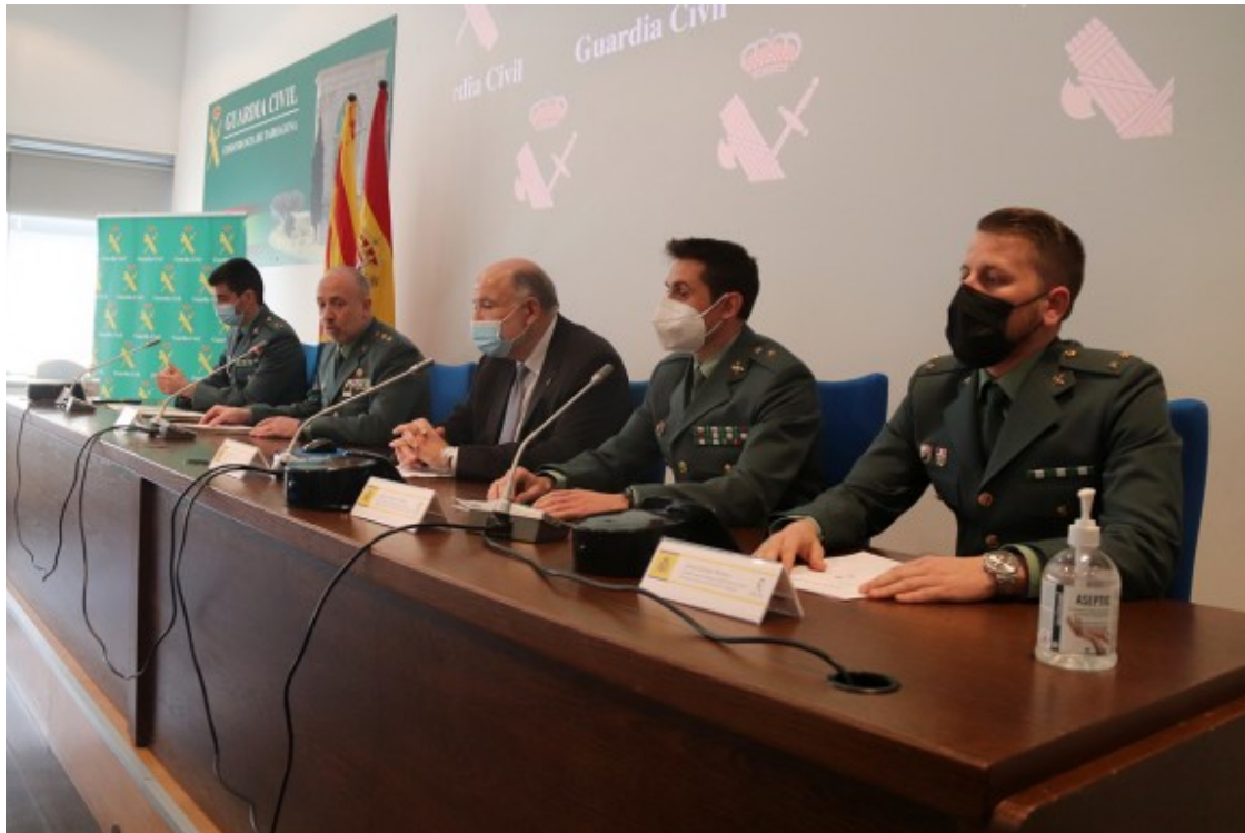
Els responsables de la Guàrdia Civil de Tarragona, explicant l'Operació Palika contra el tràfic d'haixix.