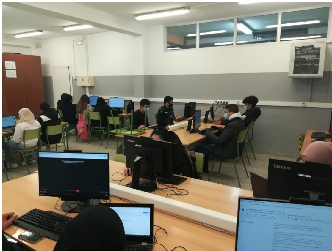
L'alumnat, a l'aula