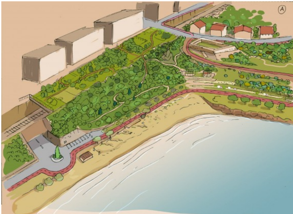
Recreació de com seria la platja del Miracle de Tarragona retirant la plataforma de ciment.