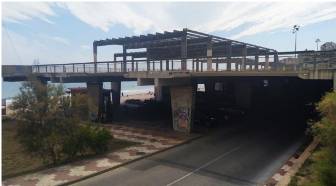
La plataforma del Miracle porta 8 anys tancada.