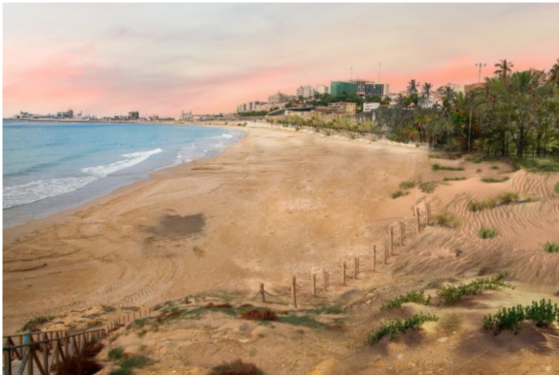
Recreació de com seria la platja del Miracle de Tarragona retirant la plataforma de ciment.

- Ara mateix tenim palmeres, que són vegetació al·lòctona, també hi ha datileres. Les plantes d'aquí serien les sables, el pi piner... Allà també hi ha pins canaris, ficus, eucaliptus... Aquí hi ha de tot.