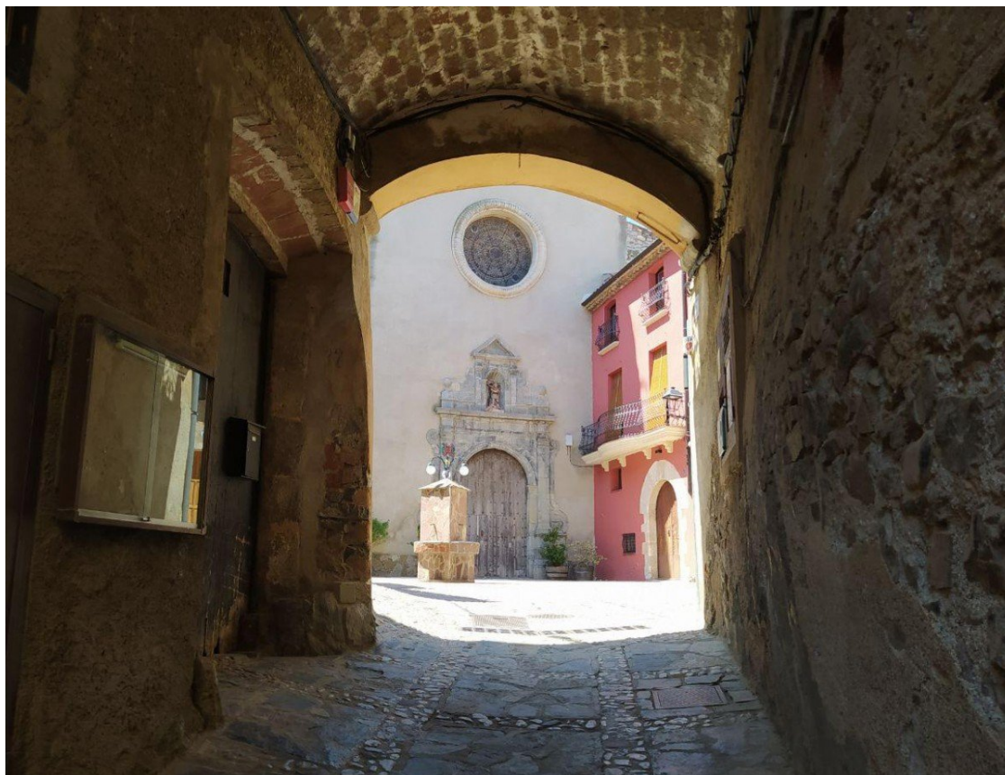
L'església de Sant Jaume, a Torroja del Priorat, des del carrer de l'Era

Localitzada justament ben bé al centre de la comarca, la població de Torroja té atractius diversos per al visitant