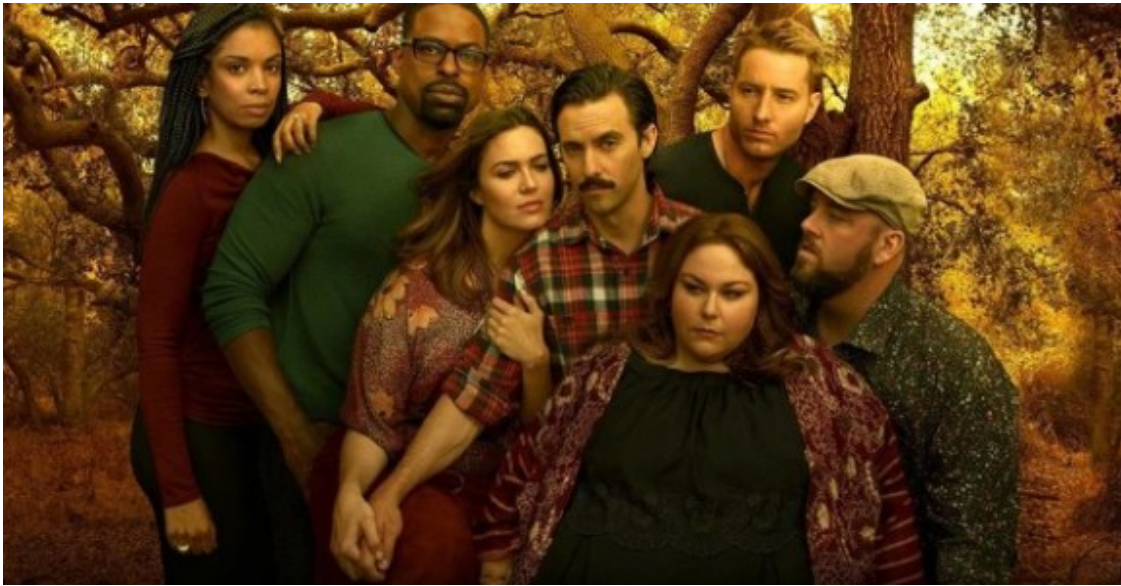
Els protagonistes de This is Us