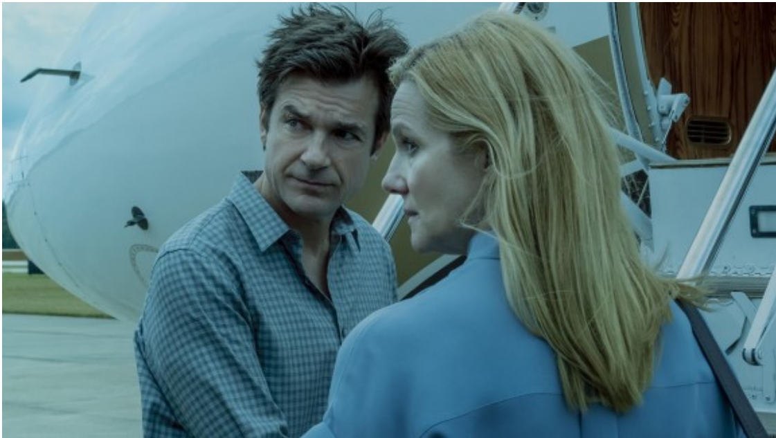
Els protagonistes de la sèrie