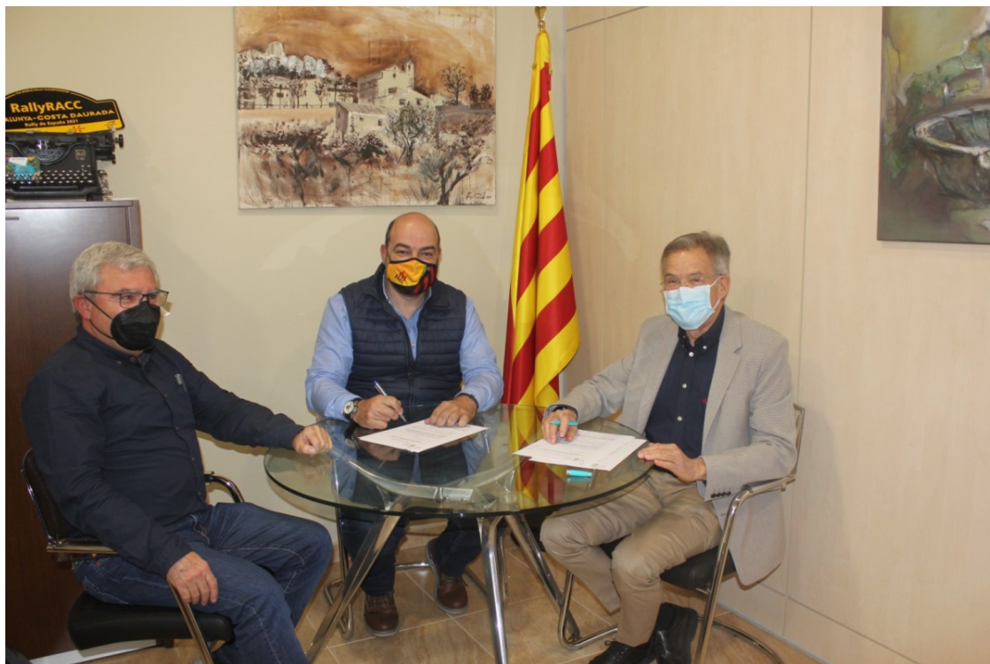
Imatge de la signatura del contracte per explotar l'alberg

Per vuit anys, amb la possibilitat de dues pròrrogues de dos anys cadascuna