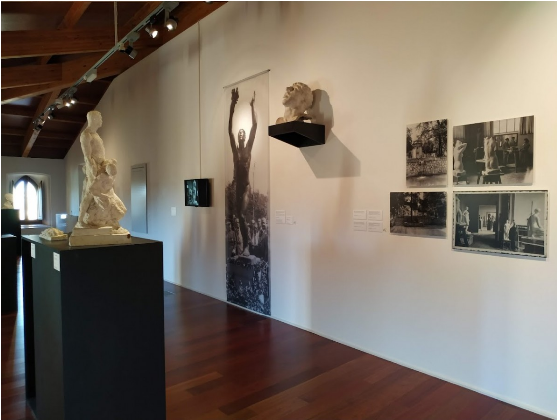
La mostra es pot visitar fins al juny

Anteriorment, i en el marc de la cooperació entre l'Ajuntament de Vila-seca i la Fundació Vila Casas, el Castell de Vila-seca ha acollit exposicions dedicades a Antoni Tàpies i Agustí Centelles.