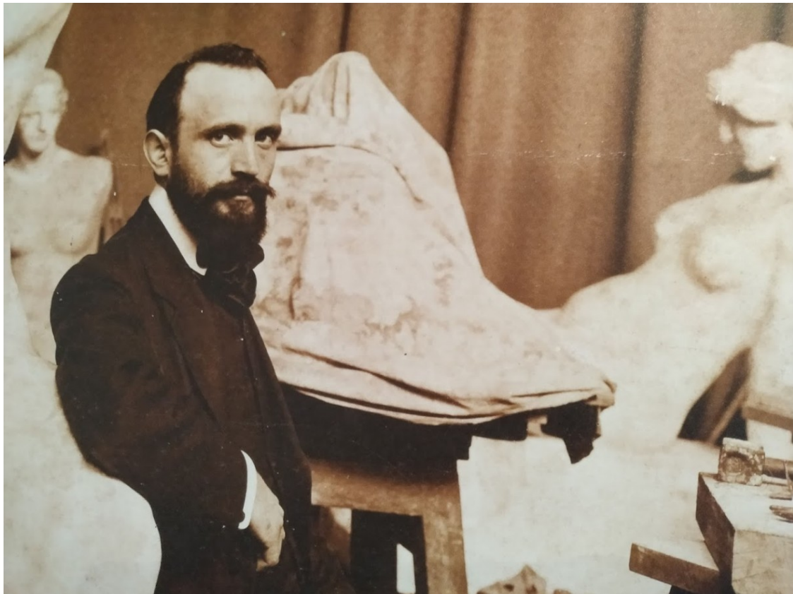
Un retrat de Josep Clarà que es mostra a l'exposició

El Castell de Vila-seca acull una mostra de l'elegant escultura de Josep Clarà