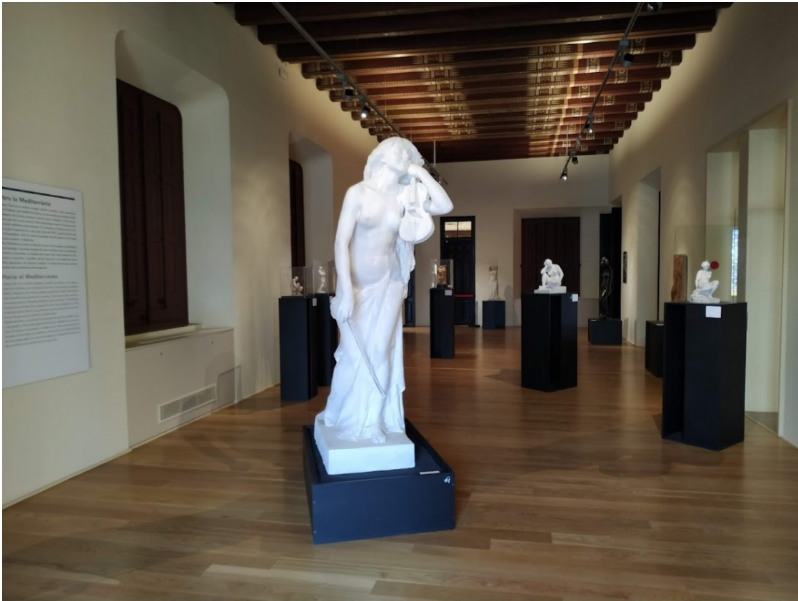
Vista d'una de les sales de la mostra

En aquesta línia, l'obra de Clarà es mostra elegant, sòlida , sense estridències. Les seves formes són suaus, "concises", segons la comissària. Vinculat al naturalisme en un inici, el cas és que a posteriori va completar un camí artístic en què va practicar diversos estils. És un exemple l'impacte que el simbolisme d'Auguste Rodin (1840-1917) va tenir en determinades etapes creatives de Clarà, qui finalment va centrar la seva atenció i la seva producció en l'expressió d'emocions i sentiments.