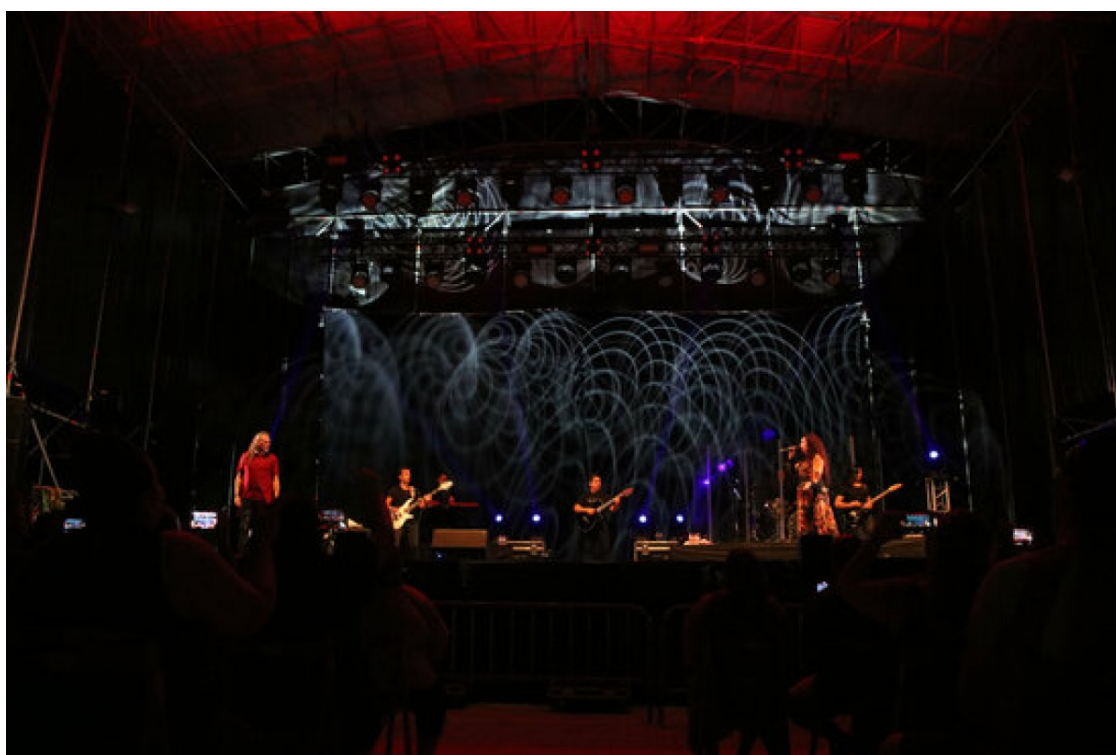
El concert de Camela al Festival Internacional de Música de Cambrils | ACN

La promotora Oceans of fire traspasa al grup la concessió del certamen