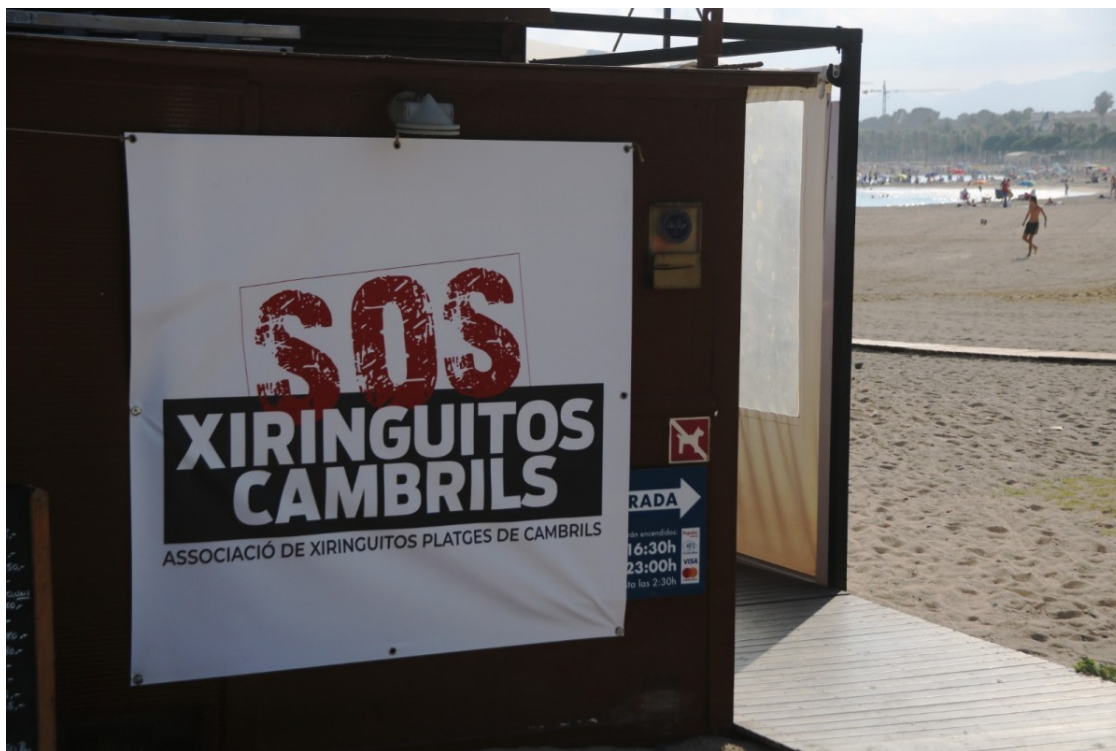
Una pancarta de l'Associació Xiringuitos Platges de Cambrils, d'aquest estiu

En un comunicat, l'entitat lamenta que "la promesa de diàleg de l'actual equip de govern de Cambrils no hagi servit de res"