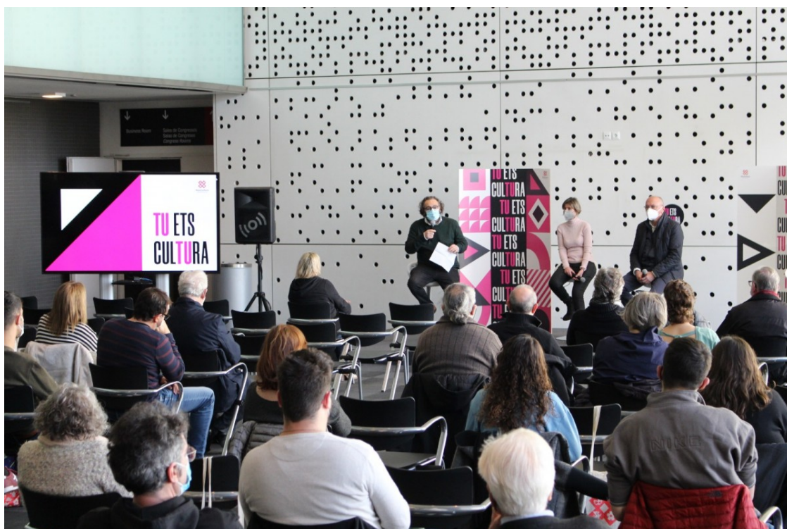
Presentació de la jornada a les instal·lacions de firaReus

Una jornada a firaReus conforma la composició dels membres que en formaran part