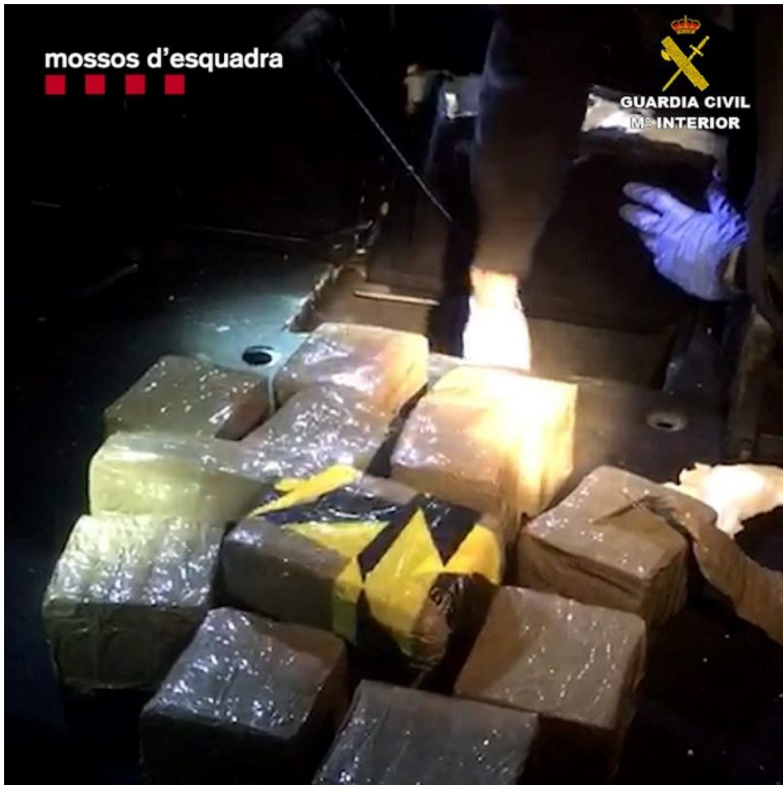
Material interceptat als detinguts

Paral·lelament, els repartidors emmagatzemaven la substància als seus domicilis per distribuir-la als consumidors finals o a d'altres intermediaris, també a través dels seus vehicles. El nou de novembre es va dur a terme l'exploració conjunta del cas, un cop obtinguts els indicis que acreditaven aquesta activitat il·lícita.