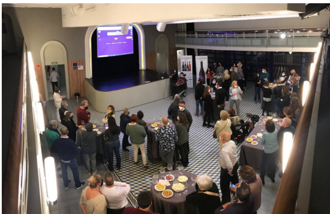
Una imatge de l'acte

La recaptació va destinada íntegrament a la Fundació Esclerosi Múltiple de Tarragona