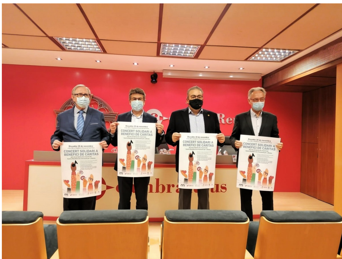
Una imatge de la roda de premsa | Alba Cartanyà

La Coral de la URV actuarà a la Prioral de Sant Pere el dissabte 20 de novembre al vespre