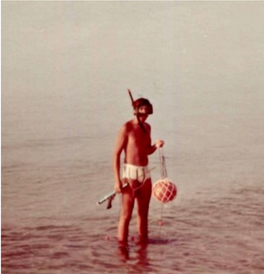
Iniciant una sessió de pesca submarina a Torredembarra

Em vaig adaptar ràpidament i sense grans problemes, perquè en general tot em va semblar millor que en el lloc d'on venia, començant pel nostre habitatge. És clar que al principi em va semblar que Tarragona era una ciutat molt petita, i vaig trobar a faltar molt els meus familiars i amiguets de Sevilla, però aviat vaig fer amics nous.