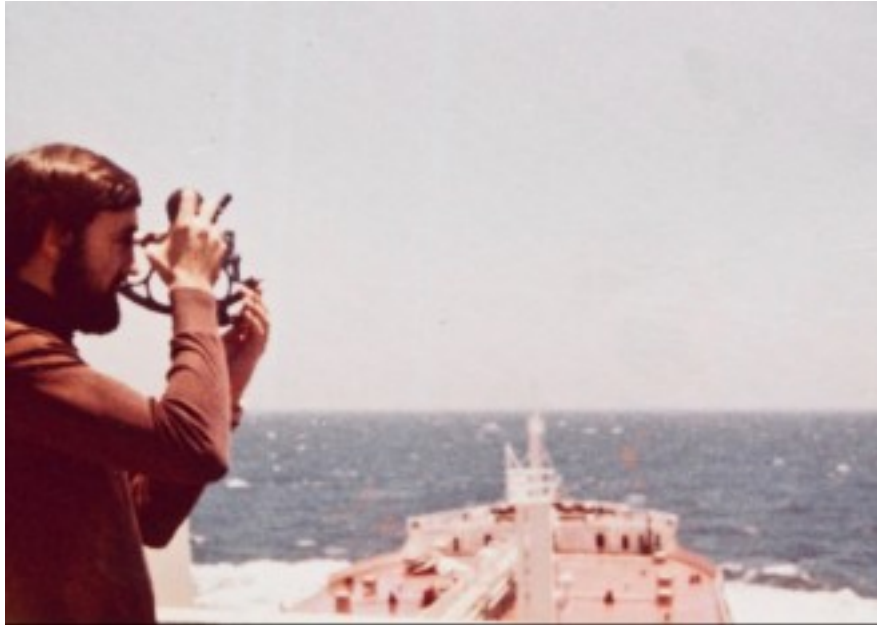
En el vaixell MERMAID

Era del tot necessari. La gent de terra ho ignora tot de la mar, la navegació, etc., així que feia falta una espècie d'introducció a aquest món. En cas contrari, al lector mitjà, fins i tot culte, li hauria estat incòmode endinsar-se de sobte en l'ambient marítim. Cal conèixer alguna cosa de la terminologia i dels costums mariners per a comprendre bé les històries sobre els viatges que es narren i els diferents episodis que tenen lloc en elles, tant de la vida a bord com de les entrades i sortides de port, etc.