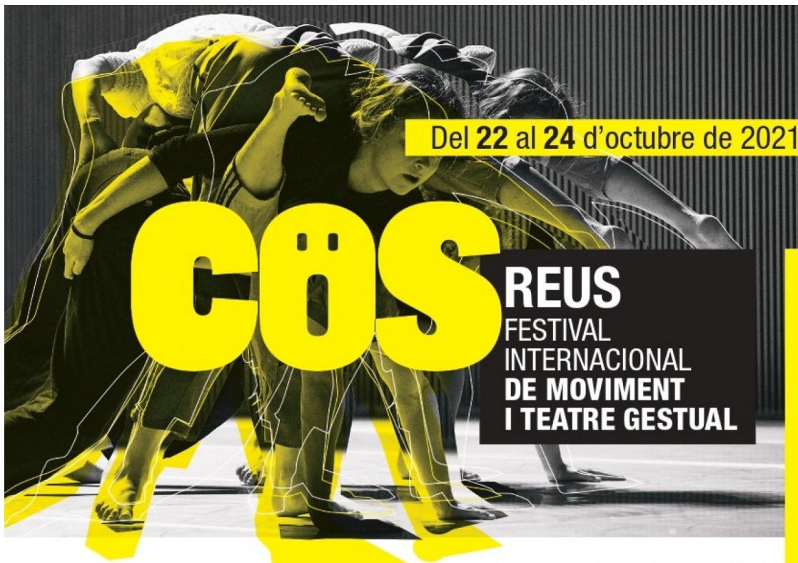
El cartell del COS 2021

La cloenda del COS anirà a càrrec de la Coordinadora d'Escoles de Dansa Autoritzades de Reus, amb les seves companyies juvenils i serà al Teatre Bartrina. La seva col·laboració és aquest any l'inici d'un projecte que encetarem de cara al festival del 2022, "on es vol incentivar aquesta professionalització de les companyies de dansa, en aquest cas creant un espectacle coproduït pel festivals amb alumnes de les mateixes escoles", han precisat fonts municipals. El COS també sortirà al carrer, amb espectacles a la plaça d'Anton Borrell, i passarà pels teatres de l'Orfeó Reusenc i la sala Santa Llúcia.