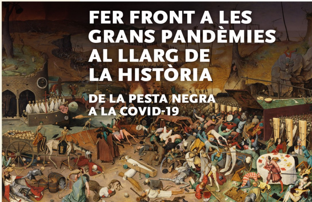
El triomf de la Mort Pieter Brueghel el Vell, 1562