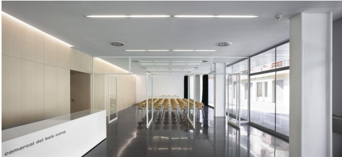
Una imatge de l'interior de l'Arxiu | Reus.cat

Té cinc sessions, i es duen a terme al novembre