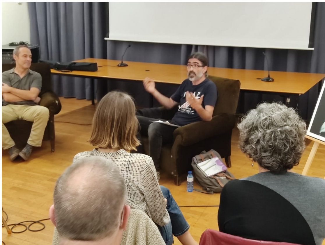
Imatge de l'acte celebrat al Centre de Lectura

Els dos van intervenir, aquest divendres, en un acte al Centre de Lectura