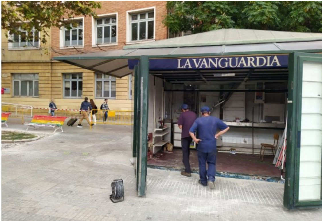
El quiosc de la plaça Imperial Tàrraco, en ple procés de desmuntatge.