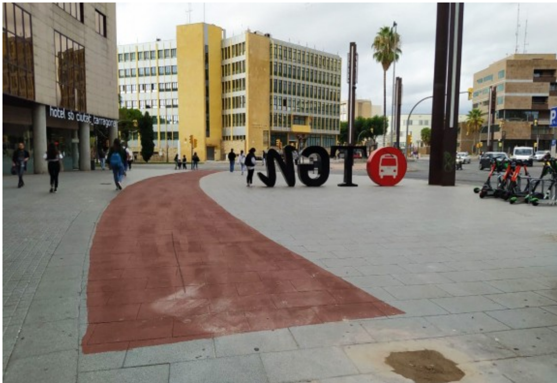
El carril bici, en ple procés d'avenç per la plaça Imperial Tàrraco.

El carril bici educatiu entre el barri de Sant Pere i Sant Pau i el carrer Pere Martell connecta 18 centres universitaris, de secundària i de primària . L'increment de l'ús de patinets elèctrics i de bicicletes així com una reivindicació històrica de diversos col·lectius van impulsar el consistori a fer efectiu el primer carril bici no d'ús recreatiu a la ciutat. L'objectiu de l'Ajuntament és connectar en un futur aquesta nova via amb el carril ja existent de la carretera N-340 en paral·lel als barris de Ponent, així com allargar el carril de Pere Martell.