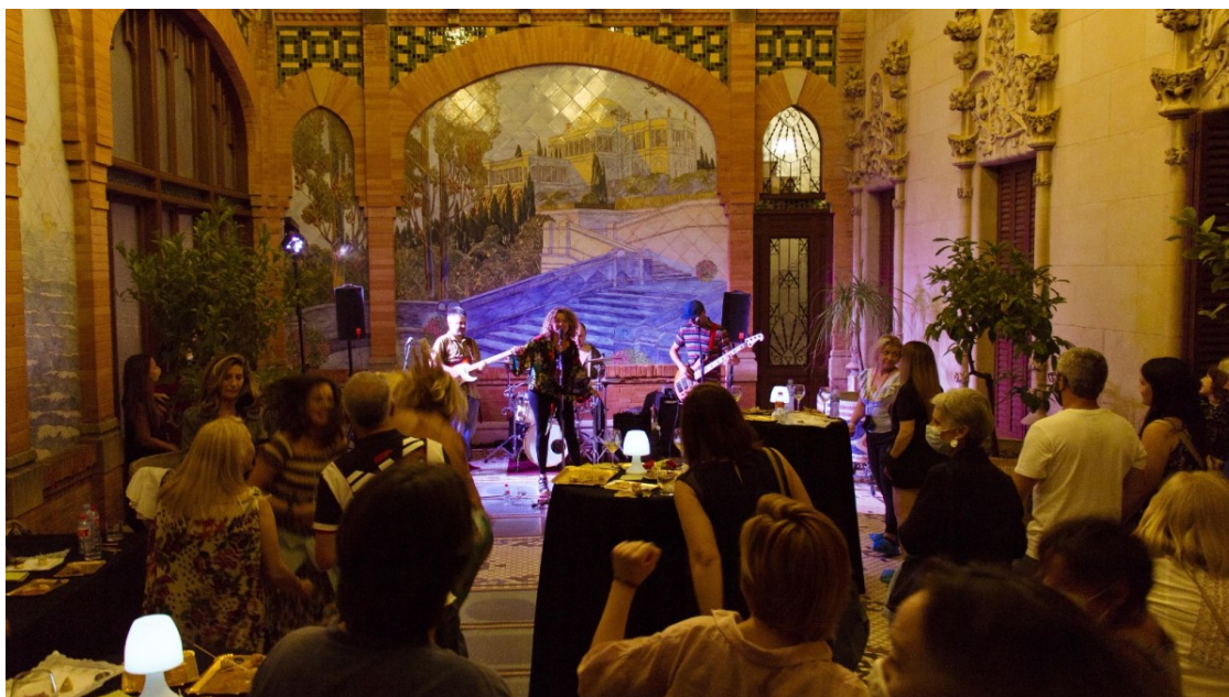
Imatge d'una revetlla a la Casa Navàs | Casa Navàs

Les noves visites, com les teatralitzades i les fotogràfiques, han tingut molt bona acollida