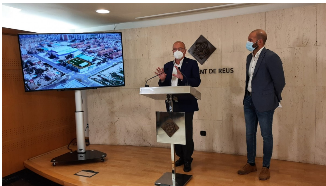
Imatge de la roda de premsa

La licitació sortirà amb un pressupost total de 82 milions d'euros