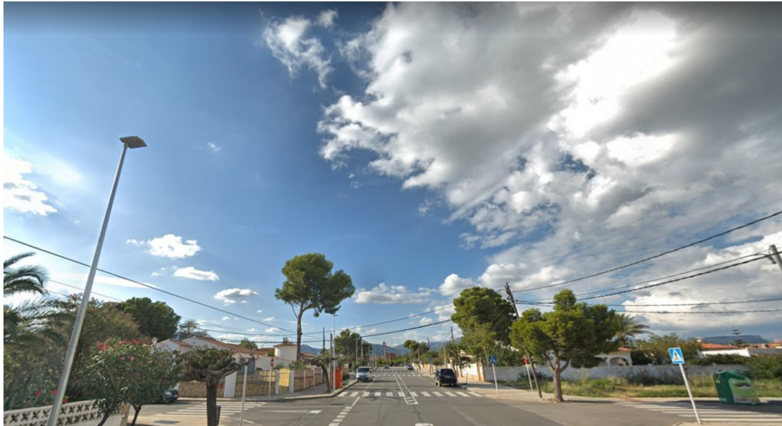
Una imatge de l'avinguda del Mar

L'Ajuntament de Mont-roig del Camp ha començat, aquest dilluns 13 de setembre, les obres de millora de l'avinguda del Mar . El projecte contempla la instal·lació de mobiliari urbà, la plantació d'arbrat, així com la creació d'un carril bici que unirà el parc esportiu Lilí Álvarez amb la plaça de Tarragona. El projecte també inclou la creació d'una mitjanera amb arbrat que separarà els dos carrils de la calçada.